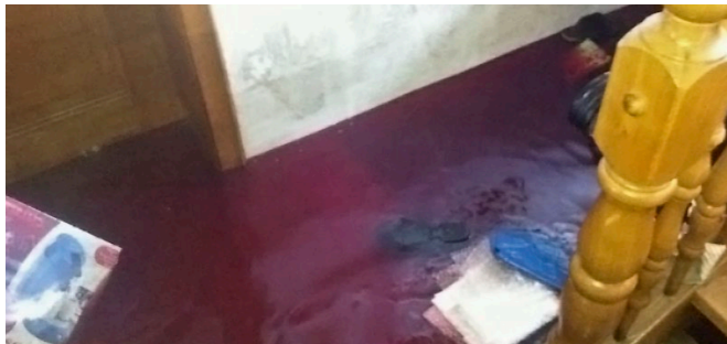
Ein Heizölschaden 2013 in Deggendorf

Ein Betroffener berichtet: „Wir wollten die Tanks gegen das Hochwasser sichern, aber es hat nichts genützt: sie sind einfach umgekippt und ausgelaufen. Überall hat es nach Heizöl gestunken, es stand sogar im Erdgeschoss noch einen halben Meter hoch. Wir haben tagelang Putz, Estrich und Mauerwerk abgeschlagen, aber vergeblich – die Ölverseuchung ging zu tief. Jetzt warten wir auf die Bagger, es bleibt nur noch der Abriss.“