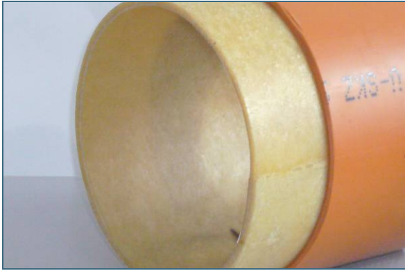
Abb. 5: Egal ob ein kleiner Schaden mit einem Kurzliner oder die ganze Leitung mit einem Schlauchliner saniert wird, es entsteht immer ein Rohr im Rohr.