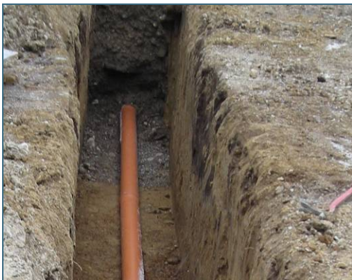
Abb. 6: Wenn eine Abwasserleitung erneuert werden muss, ist es sinnvoll, sie mit wenigen Bögen zu verlegen. So kann sie in Zukunft leichter geprüft werden.

Wenn eine Abwasserleitung so stark beschädigt ist, dass sie z. B. teilweise eingestürzt ist oder die anfallende Abwassermenge nicht mehr fasst, ist es sinnvoll, eine neue Leitung zu verlegen. Die Neuverlegung in offener Bauweise bietet sich an, wenn die Leitungen nicht besonders tief im Erdreich verlegt sind und der Raum über der Leitung nicht überbaut oder hochwertig versiegelt ist. Wichtig ist, dass die offene Baugrube die Standsicherheit des Gebäudes oder umstehender Bäume nicht gefährdet.