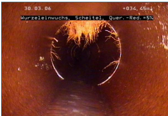
Abb. 3: Wurzeln, die in die Abwasserleitung einwachsen, müssen entfernt werden, sonst verstopft die Leitung. In diesem Beispiel ist die Sanierungspriorität mittel bis hoch.

Zum Ergebnis der optischen Inspektion gehören auch die Auflistung der Schäden und deren Bewertung im Hinblick auf die Sanierungspriorität. Dabei werden drei Prioritäten unterschieden: „sehr gering bis gering“, „mittel bis hoch“ und „sehr hoch“.