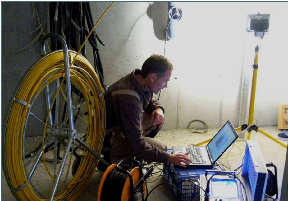
Abb. 2: Ohne Baustelle und Dreck wird bei einer optischen Inspektion die Kamera z. B. über eine Revisionsöffnung im Keller in die Abwasserleitung geschoben.

schlusskanal in die Grundleitung geschoben. Speziell ausgerüstete Kameras können auch in weitere Abzweige vorgeschoben werden. Vor der optischen Inspektion werden die Abwasserleitungen mit Hochdruck-Spüldüsen gereinigt. Diese werden auch über Revisionssschächte oder Reinigungsöffnungen eingeschoben und entfernen lose Verschmutzungen und Ablagerungen.