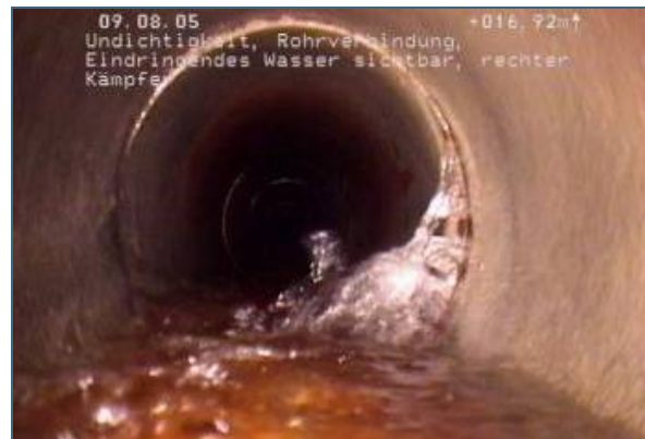
Abb. 4: Wenn aber Grundwasser in die Leitung eindringt, muss schnell gehandelt werden. Hier ist die Sanierungspriorität sehr hoch.

Mit der Inspektionsfirma sollte vor Auftragsvergabe geklärt werden, ob sie auch eine vorläufige Bewertung der Schäden nach DIN 1986-30 (Entwurf September 2010) durchführen kann. Bei großen Grundstücksentwässerungsanlagen (z. B. bei Schulen und Kasernen), Leitungsdurchmessern über 250 mm und Anlagen mit großem Sanierungsbedarf ist es empfehlenswert, die genaue Bewertung und die anschließende Sanierungsplanung an ein fachlich geeignetes Ingenieurbüro zu vergeben.